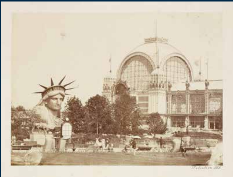
Delintraiz, Exposition universelle de 1878 : palais du Champ-de-Mars et statue de la Liberté du sculpteur Bartholdi . Archives nationales, F/12/11914.