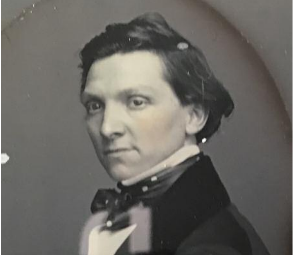
Investigation on a NYC Dag, page 5