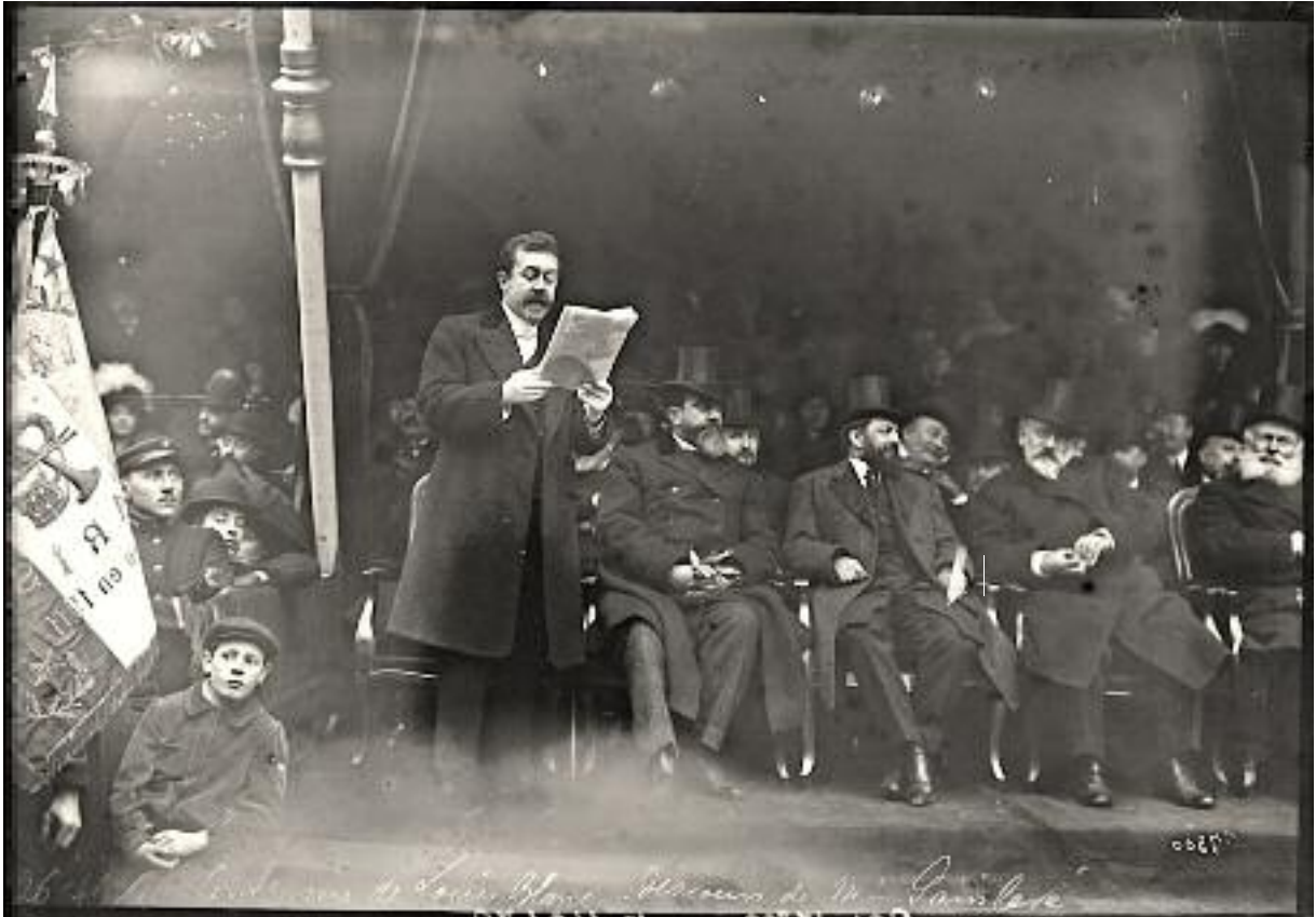
Centenaire de la naissance de Louis Blanc, 1911

1839 AD was not only the year of the proclamation in France of the invention of photography by François Arago but also the proclamation of the Right to Work by Louis Blanc in his Revue du Progrès. Arago and Blanc will become two leaders of the February 1848 Revolution and two Members of the Cabinet, when Blanc brother will become Head of Culture and Art administration.