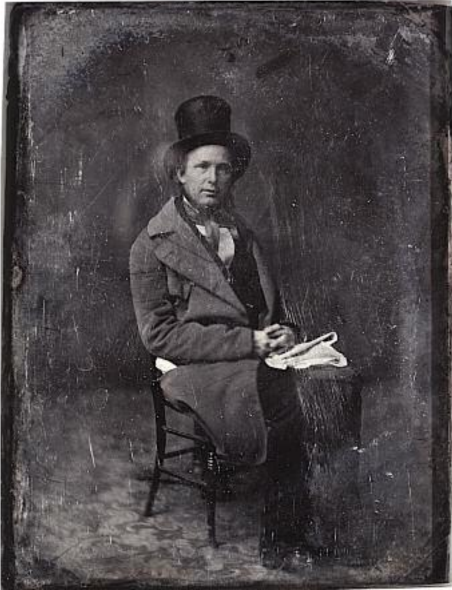
MATHEW BRADY. Horace Greeley, full-length portrait, three-quarters to the right, seated in chair, wearing tall hat, folded newspaper in lap, carpet on floor. Half-plate daguerreotype, gold toned. Actual location : Library of Congress, Collection of daguerreotypes.

Published in: Eyes of the Nation : a visual history of the United States . New York, 1997. In the Library of Congress, 384 of the daguerreotypes are credited to Mathew Brady's studio. Brady, who today is mainly remembered for the work produced by his studio during the Civil War, opened his first daguerreotype studio in New York City in 1844. The Library has the largest collection of Brady studio daguerreotypes in existence. Many of the sitters are unidentified.